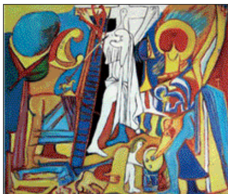
Picasso (1881 - 1973)