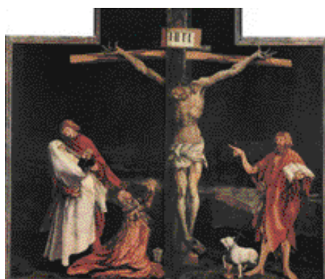
Mathis von Aschaffenburg, dit «Grünewald» (1475-1529)

Cette proposition sera complétée par une approche des sources scripturaires (textes canoniques et apocryphes) associée à l'étude des personnages historiques et à travers les analyses des historiens contemporains.