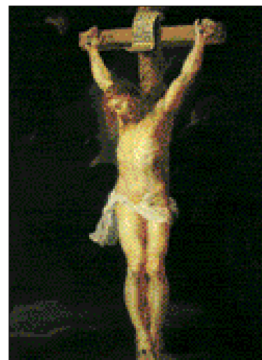
Rubens (1577 - 1640)